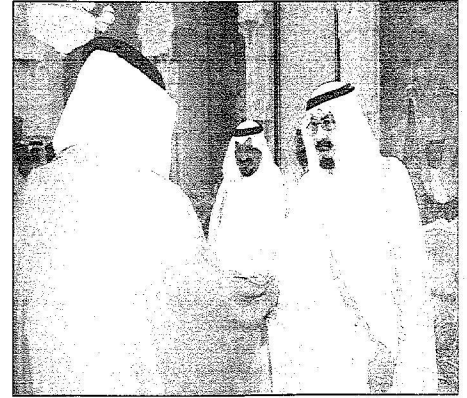
خادم الحرمين يستقبل الأمراء والقطان والشيخ والقيادة

استقبل أصحاب السمو الأمراء والعلماء والوزراء ومنسوبي أمن الحج