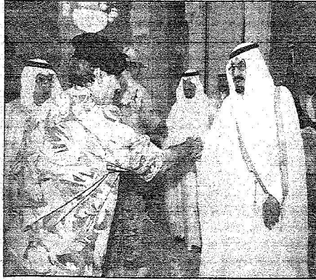
خادم الحرمين خلال الاستقبال