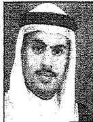
الشيخ خليفة بن سعيد آل خليفة