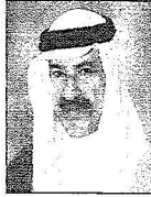
الشيخ إبراهيم بن سلمان آل خليفة