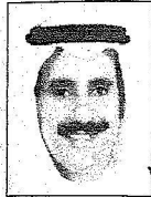
الشيخ راشد بن إبراهيم آل خليفة