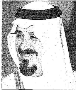
الأمير سلطان بن عبدالعزيز ولي العهد