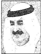
الشيخ طعي بن خليفة آل خليفة