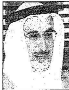
الشيخ خالد بن إبراهيم آل خليفة