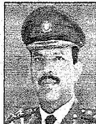
الشيخ خليفة بن أحمد آل خليفة