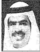
الشيخ فوزان بن محمد آل خليفة