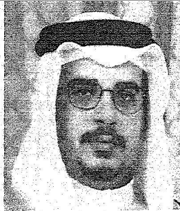
سلمان بن حمد آل خليفة ولي عهد البحرين