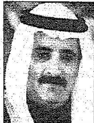
الشيخ سلمان بن إبراهيم آل خليفة