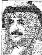
الشيخ سلمان بن خليفة آل خليفة