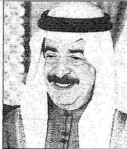
الشيخ خليفة بن سلمان آل خليفة