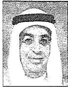
الشيخ محمد بن إبراهيم آل خليفة