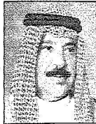
الشيخ خالد بن أحمد آل خليفة