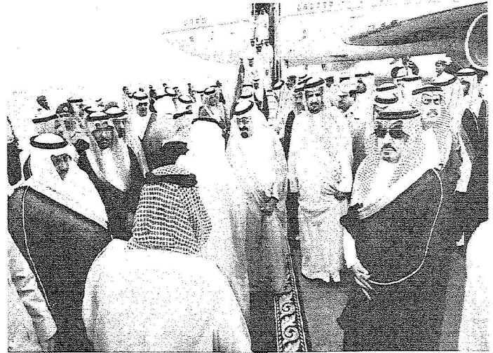
خادم الحرمين الشريفين لدى وصوله الجوف، أمس.