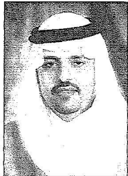
نائب أمير حائل

الجامعية بأن لا تهاون في قضية الجودة في كل مجالات الجامعة المختلفة والحرص على قبول الطلاب المتميزين وتخريج أكفاء يبحث عنهم سوق العمل قبل أن يبحثوا هم عن الوظيفة.. وأمام هذه الخطوات الفاعلة والتي لا زالت في أول الطريق وبحاجة إلى المزيد من العمل الشاق والمضني من أجل استكمال كافة احتياجات مستقبل جامعة حائل يأتي اليوم ليحتفل الوطن بتخريج هذه الدفعة الجديدة من الجامعة ليرسم لنا صورة تفاؤلية أكثر إشراقاً وإن البناء يسير في الاتجاه الذي يحلم به الجميع. وأكد الدكتور السيف أن جامعة حائل ولله الحمد أصبحت متميزة بفضل الدعم غير المحدود الذي تلقاه من