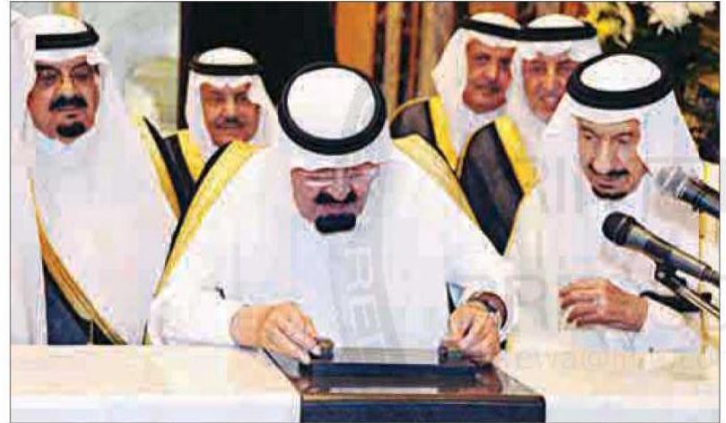
خادم الحرمين يضع حجر الأساس لتوسعة المسجد الحرام ويفتح عددا من المشاريع التطويرية للحرمين الشريفين والشاعر المقدسة

افتتح عددا من المشاريع التطويرية للحرمين الشريفين والمشاعر المقدسة