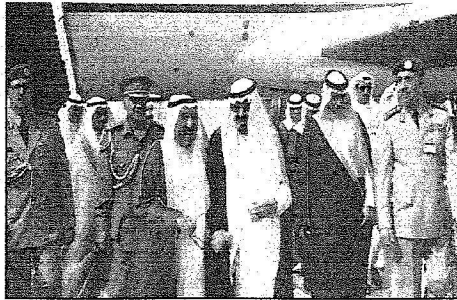
خادم الحرمين الشريفين في استقبال سمو أمير دولة الكويت