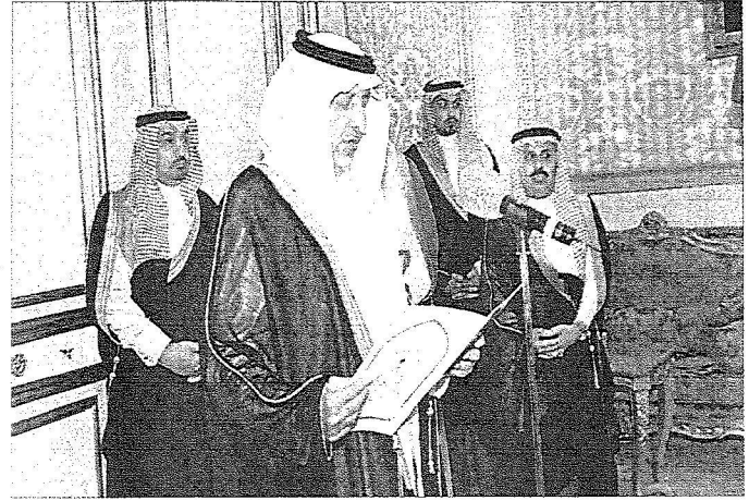
الأمير خالد الفيصل يزور القسم بين يدي الملك