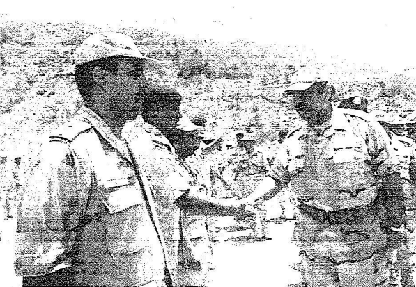
سموه يصفح الأبطال

وتتزم كل الشعب لخدمتهم وأنا متأكد أن الدعم سيكون أكثر من القطاعات.. وفي سؤال حول استكمال منظومة المواقع للقوات المسلحة على الشريط الحدودي وما هو الدور الذي يمكن أن تقوم به القوات المسلحة لمنع التسلسل والتجريب قال سموه: الآن أعيد الأمن كما هو عليه وتولى حرس الحدود المهام لكل المراكز الموجودة وتأكدوا أن سمو سيني النائب الثاني ووزير الداخلية الأمير نايف لا يألوا جهداً في تعزيز عمل ما هو ممكن في تعزيز وحدات مراكز حرس الحدود . القوات المسلحة سوف تتواجد بكثرة وتتواجد دائما لردع أي متسلل وبشكل افضل ويجوار حرس الحدود وحول