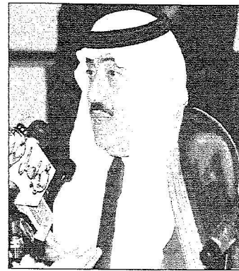
الأمير متعب بن عبدالله ومعالي الأستاذ عبدالحسن قنويري والكتور عبدالعزيز خوجه خلال المؤتمر