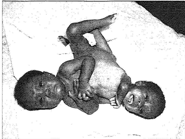
الطفلتان قبل فصلهما.