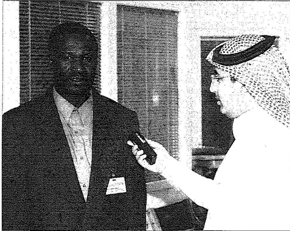
والد الطفلتين يتحدث للزميل النفعي.