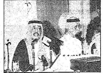
الأمير مقرن يتحدث في الإثنية

الأمير مقرن: الاستخبارات تعمل لأمن المواطن واستقرار الوطن