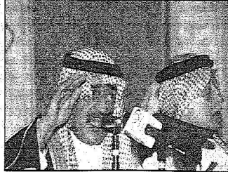
الأمير مقرن يتحدث في الإثنية وإلى جواره عبدالصود خوجة