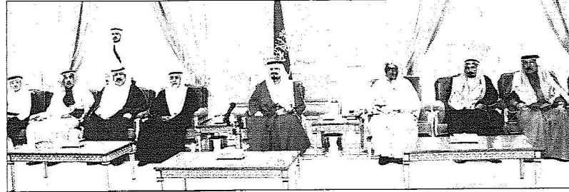
سموه خلال استقبله جموعاً من المواطنين والعلماء

خالصة لوجهه الكريم .، إنه سعيد مجيب . واستقبل نائب الملك اص قائد القيادة المركزية الأمريكية الفريق أول ديفيد بترايوس والوفد المرافق له . وجرى خلال الاستقبال تبادل الأحاديث الودية وبحث الموضوعات ذات الاهتمام المشترك. حضر الاستقبال صاحب السمو الأمير الدكتور مشعل بن عبدالله بن مسعود مستشار سمو ولي العهد ومعالي رئيس ديوان سمو ولي العهد علي بن إبراهيم الحديدي ومعالي مدير عام مكتب سمو ولي العهد نائب رئيس مجلس الوزراء وزير الدفاع والطيران والمفتش العام الفريق أول الدكتور علي بن محمد الخليفة والسكرتير الخاص لسمو ولي العهد محمد بن سالم المري