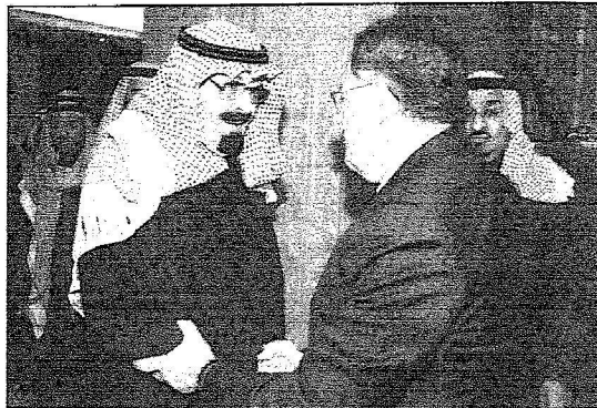
خادم الحرمين مستقبلاً رئيس مجلس الوزراء اللبناني

وقد عقد خادم الحرمين الشريفين ودولة رئيس مجلس وزراء لبنان اجتماعاً امس في مقر إقامة الملك المفدى حفظه الله بروضة خريم . وجرى خلال الاجتماع بحث تطورات الأوضاع في لبنان إضافة إلى اتفاق التعاون بين البلدين الشقيقين . حضر الاجتماع من الجانب السعودي صاحب السمو الملكي الامير