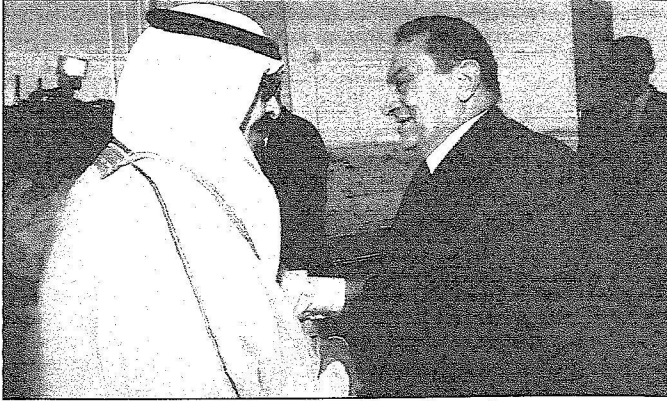
خادم الحرمين يستقبل الرئيس المصري