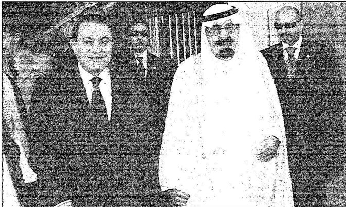
خادم الحرمين خلال استقباله الرئيس المصري

مبارك في موكب رسمي إلى ميناء جدة الإسلامي. ويضم الوفد الرسمي المرافق لفخامة الرئيس المصري كلا من معالي وزير الخارجية الأستاذ أحمد أبو الغيط ومعالي وزير النقل المهندس محمد منصور ورئيس المخابرات العامة عمر سليمان ورئيس ديوان رئيس الجمهورية الدكتور زكريا عزمي.