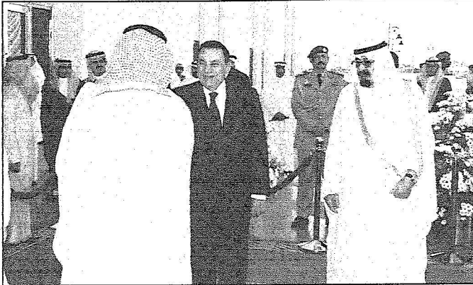
الرئيس المصري يصفاح اصحاب السمو والمعالي

عبدالرحمن بن عبدالعزيز نائب وزير الدفاع والطيران والمفتش العام وصاحب السمو الملكي الأمير متعب بن عبدالعزيز وزير الشؤون البلدية والقروية وصاحب السمو الملكي الأمير مقرن بن عبدالعزيز رئيس الاستخبارات العامة وصاحب السمو الأمير فيصل بن عبدالله بن محمد آل سعود مساعد رئيس الاستخبارات العامة وصاحب السمو الملكي الأمير