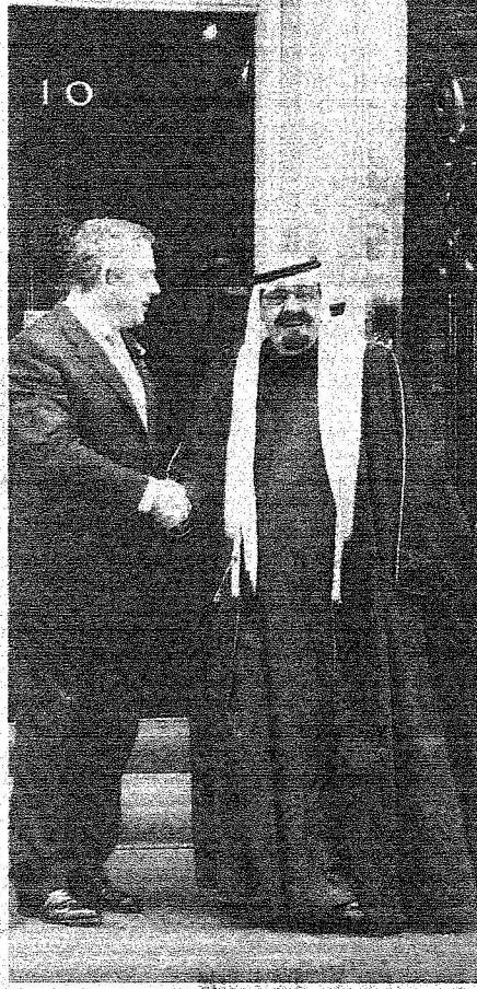
المليك بصافح بروان