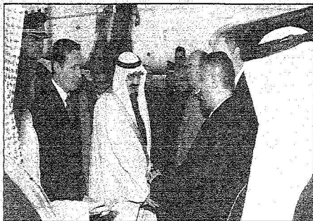
خادم الحرمين يصانح مستقبله لدى وصوله تركيا