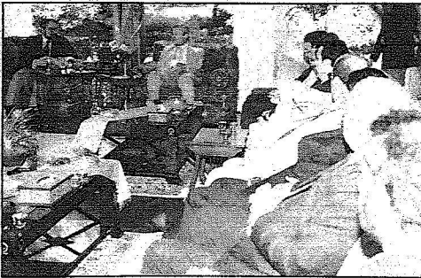
الأمير سعود الفيصل خلال لقائه الوفد الإعلامي.

« قال صاحب السمو الملكي الأمير سعود الفيصل وزير الخارجية بأن زيارة خادم الحرمين الشريفين الملك عبدالله بن عبدالعزيز إلى بولندا تأتي بناء على دعوة وجهت له من قبل الرئيس البولندي عندما زار المملكة في العام الماضي وأكد سموه بأن بولندا دولة مهممة في الاتحاد الأوروبي وهي أكبر دولة فيه وإن العلاقات الثنائية بين البلدين جيدة وإن الزيارة ستساهم في تعزيز ليس فقط العلاقات السعودية البولندية ولكن العلاقات العربية البولندية. وكان سمو وزير الخارجية التقى امس