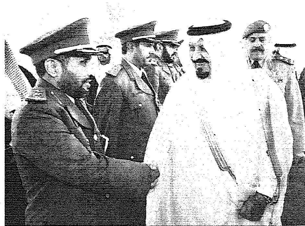
ولي العهد يصافح أحد ضباط مجموعة الدفاع الجوي الثالثة خلال معايدته منسوبيها أمس.