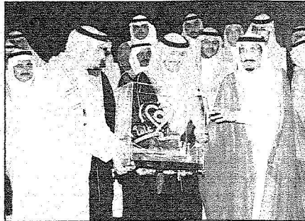
الأمير سلطان بن سلمان يقدم مرمعاً تذكاريّاً للأمير سلمان