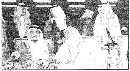
الأمير سلمان وسامة المفتي واصحاب السمو خلال المؤتمر

بعد ذلك سلم سمو الامير سلمان وسام العضوية الشرفية للمداعمين كما تسلم هدية تذكارية من اطفال الجمعية بهذه المناسبة فيما تسلم صاحب السمو الملكي الامير سلطان بن سلمان بن عبدالعزيز هدية تذكارية من اطفال الجمعية. ثم التقطت الصور التذكارية بحضور افراد اصحاب السمو الملكي الامراء واصحاب الفضيلة العلماء والعلما الوزراء وعدد من المستقلين من مدنيين