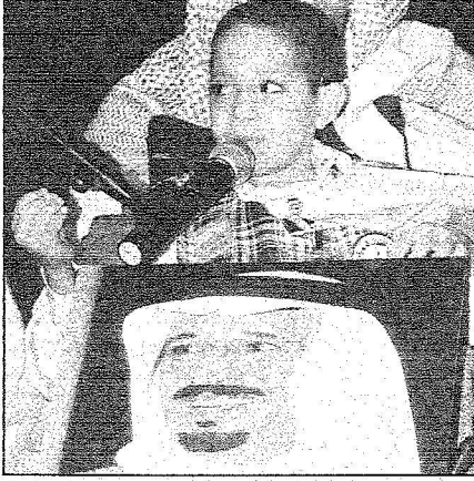
أحد الأطفال المعوقين خلال كلمته لتكريم سلمان