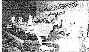
الطلاب أثناء التسجيل