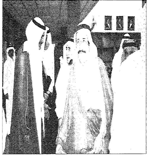
دعوى خلال الاجراء على المستشارات أعضاء مجلس الشورى