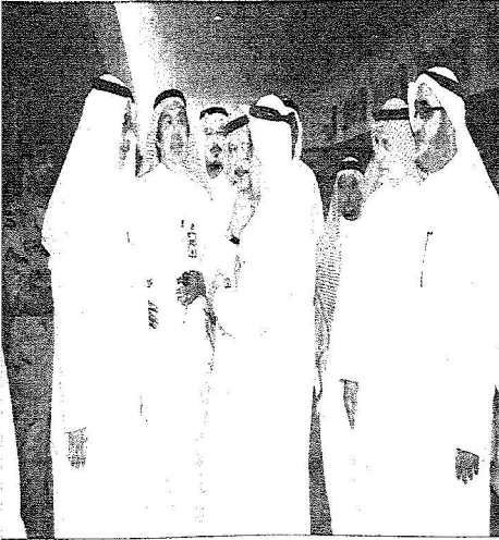
التقائ كان ساكنين الأعضاء ومندوبي هيئة الطيران