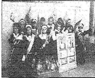
مطالعات في حفر الباطن يقدّمن أحد الأعمال