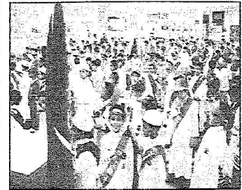
الاحتفالات في الجوف