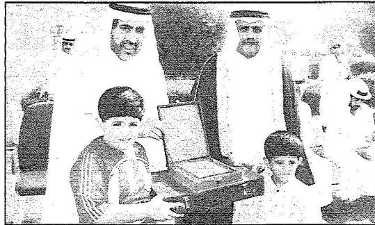
المهندس مساعد عليم يحرم أبناء شهداء الواجب

وتذكر مدير عام التربية والتعليم لمبنيين في المحافظة محمد بن سعيد أبو رأس أن المدارس قامت وفق خطة أعدتها الإدارة بتوجيه برامجها وأنشطتها للاحتفاء باليوم الوطني للمملكة، مشيراً إلى أن البرامج تنوعت ما بين الندوات والمحاضرات واستضافة الشخصيات البارزة في المحافظة والقيام بزيارات لبعض المنشآت الحضارية في المملكة. وإبراز مكانة المملكة