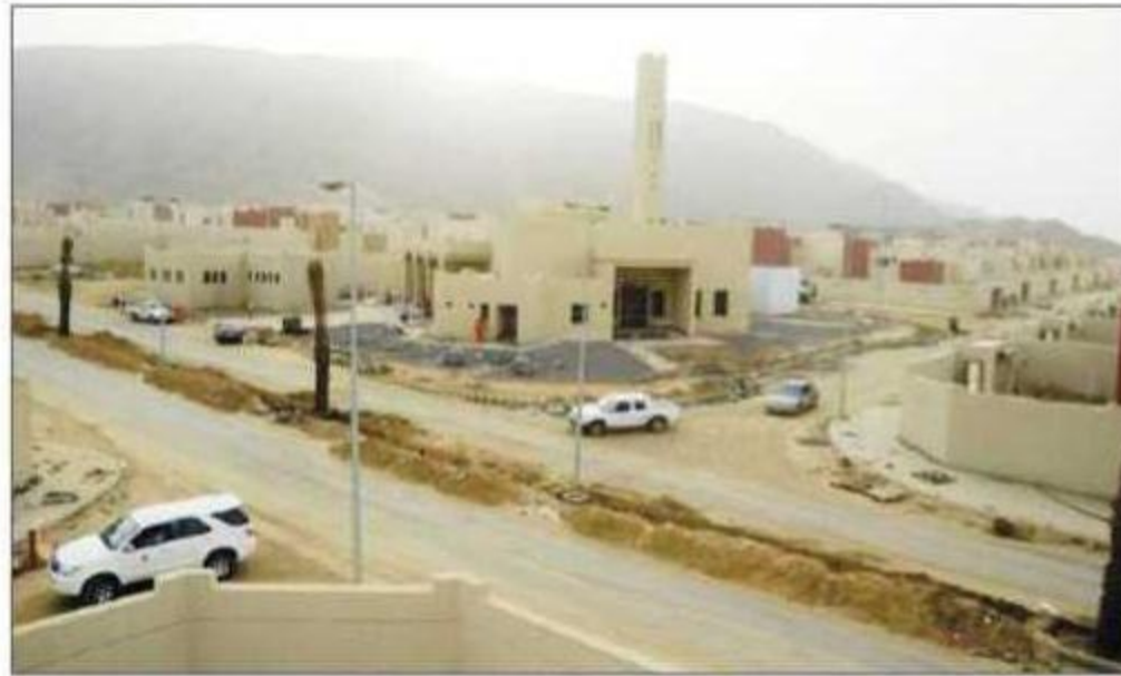
تكمّل الخدمات في الموقع