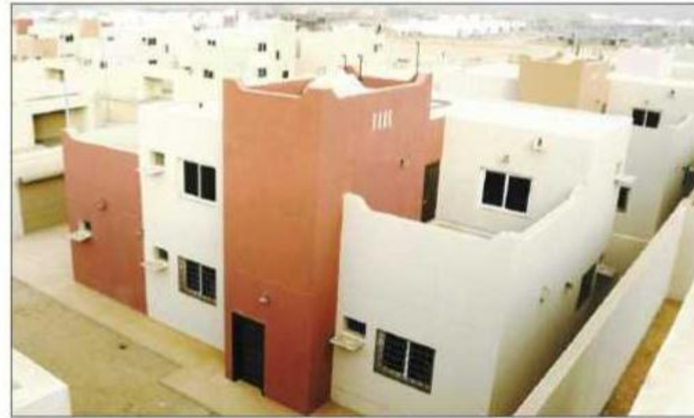
أحد المنازل ويبدو جاهزاً