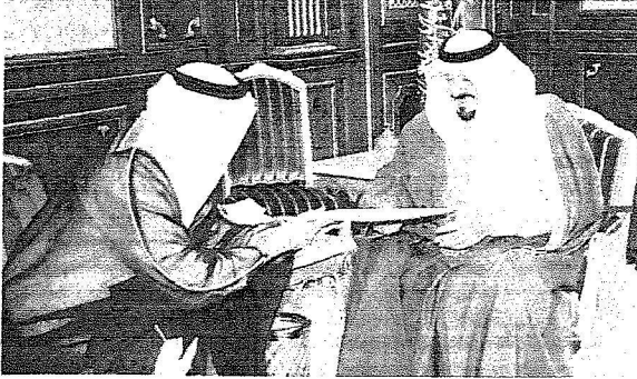
ولي العهد يتسلم رسالة الشيخ محمد بن زايد آل نهيان من العصري الظاهري سفير الإمارات لدى المملكة.