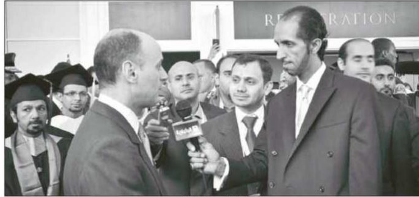
السفير الجبير يصرح للإعلام

يتحدث عنها البعض ليست موجودة ونسبة المشاكل التي تواجه المعتنقين في أمريكا تعد قليلة جداً. وحسب من يصلنا من الجهات المسؤولة في أمريكا بان الجالية السعودية هي من أكثر الجاليات المنتظمة بالنسبة لتعاملها مع القوانين ومع الإجراءات وبالنسبة لقلة المشاكل. معتبراً ان هذه الانتقادات التي تظهر من وقت الى آخر ليس لها أساس من الصحة.