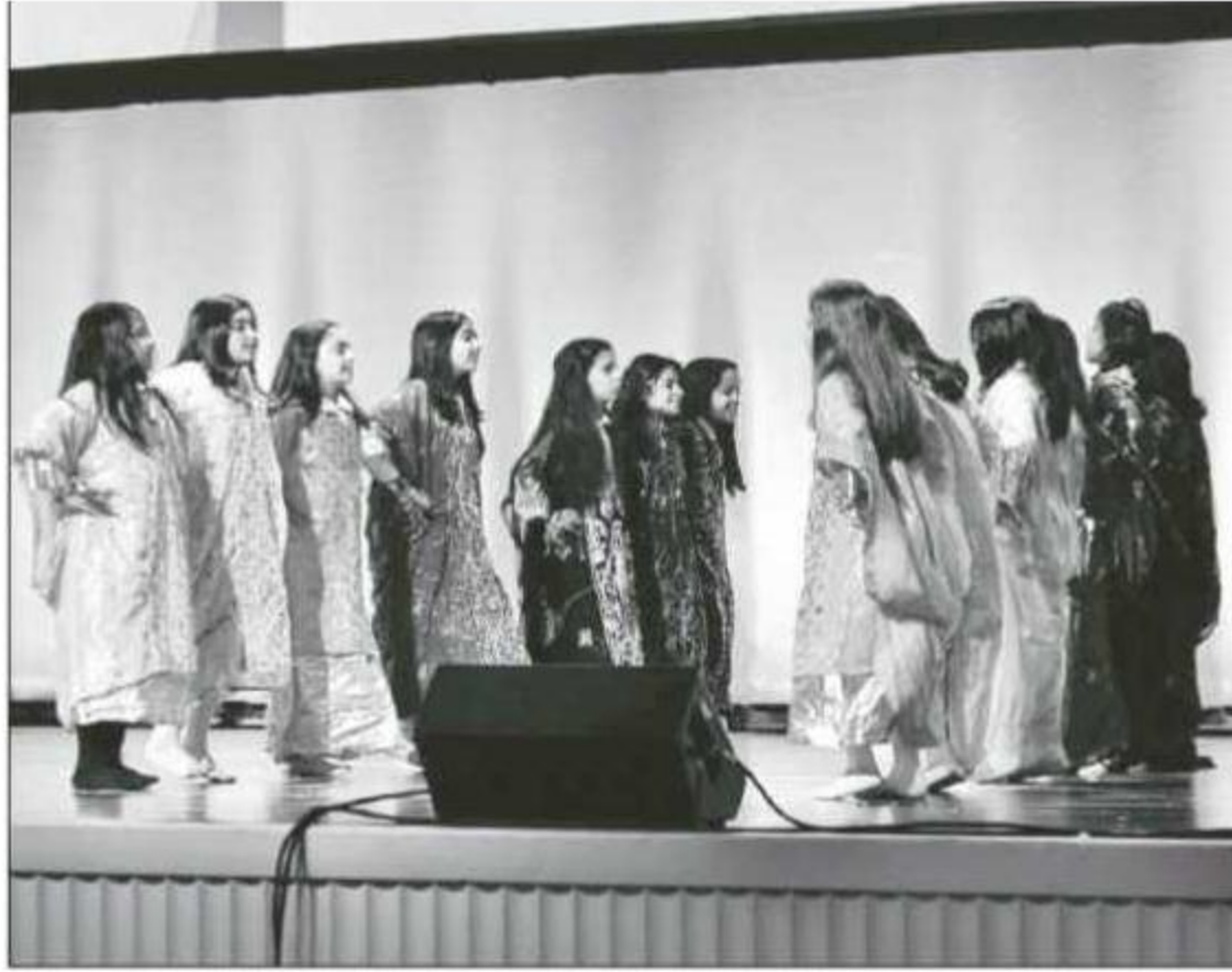
عرض للأطفال خلال الحفل

التاريخ: 2012-05-28 رقم العدد: 16044 رقم الصفحة: 7 مسلسل: 32 رقم القصة: 1