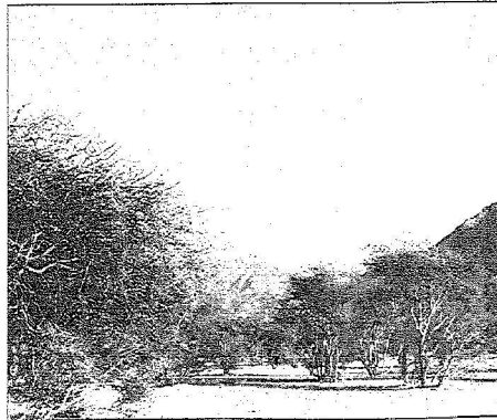
الغابات الكثيفة معتمدة الزوار في طاشا