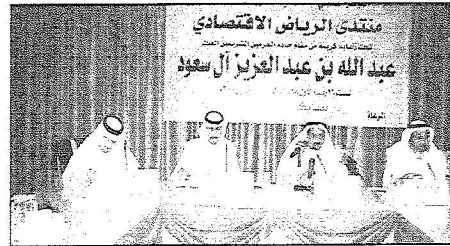
جانب من المؤتمر الصحفى الخاص بمختدى الرياض الاقتصاى