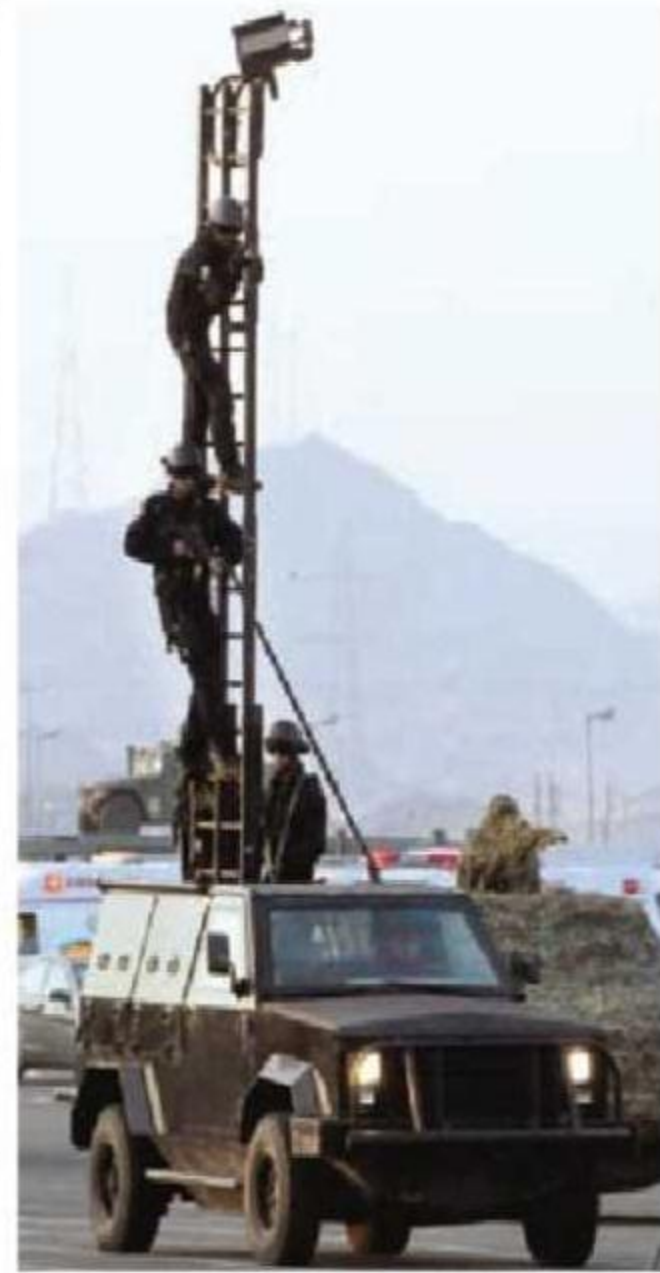
مهارات عالية لقوات الأمن

واستهل الأمير نايف بن عبد العزيز الجولة بزيارة لمسكرات قوات الطوارئ الخاصة المقامة في موقف حجز السيارات الصغيرة على طريق مكة المكرمة الطائف السريع " الكر "، حيث كان في استقباله مساعد وزير الداخلية للشؤون الأمنية الأمير محمد بن نايف بن عبدالعزيز، ومدير الأمن العام رئيس اللجنة الأمنية الفريق سعيد بن عبدالله القحطاني. وكان الأمير نايف بن عبد العزيز، قد وصل إلى ميدان العرض العسكري في عرفات في تمام الساعة ٥:٣٥ عصرًا، وفور وصوله عزف السلام الملكي ثم صاحق قيادات أمن الحج وبعد أن أخذ مكانه في المنصة الرئيسة بدئ الحفل الخطابي المعد لهذه المناسبة بتلاوة آيات من القرآن الكريم. وألقى مدير الأمن العام الفريق سعيد القحطاني كلمة، أكد فيها على جاهزية القوات الأمنية لخدمة ضيوف الرحمن، مشيداً بالمشروعات الكبيرة التي تم تنفيذها بمكة المكرمة والمساعر المقدسة وفي مقدمتها مشروع توسعة الساحات الشمالية للمسجد الحرام، ومشروع جسر الجمرات الجديد ومشروع قطار المساعر الذي سيؤدي إلى التخفيف من آلاف حافلة. وقال إن الأجهزة الأمنية سوف تتصدى لكل الأعمال وتعمل على حفظ الأمن مستعينة في ذلك بمختلف الإمكانيات والتقنيات الحديثة، مشيداً بتلك الاستعدادات التي هيئت لمختلف الجهات والقطاعات الأمنية لموسم حج هذا العام. وبين أن مكة المكرمة والمساعر المقدسة تشهد في أيام معدودات وقوف المسلمين بين