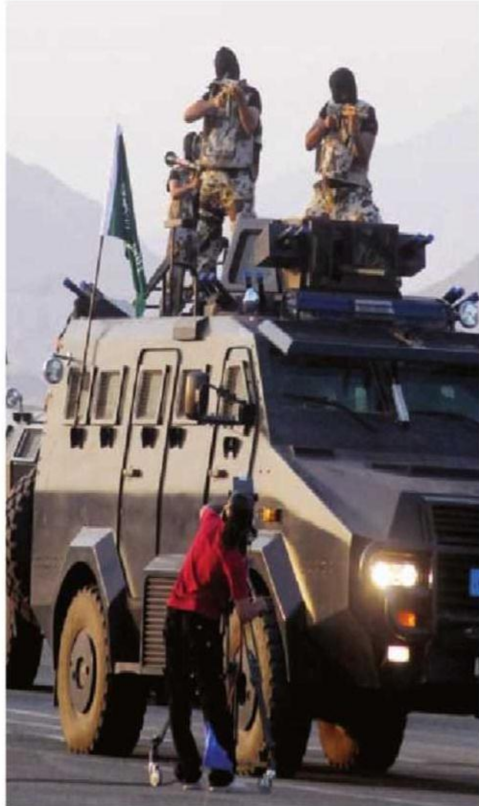
مركبة عسكرية مجهزة بالعتاد والرجال