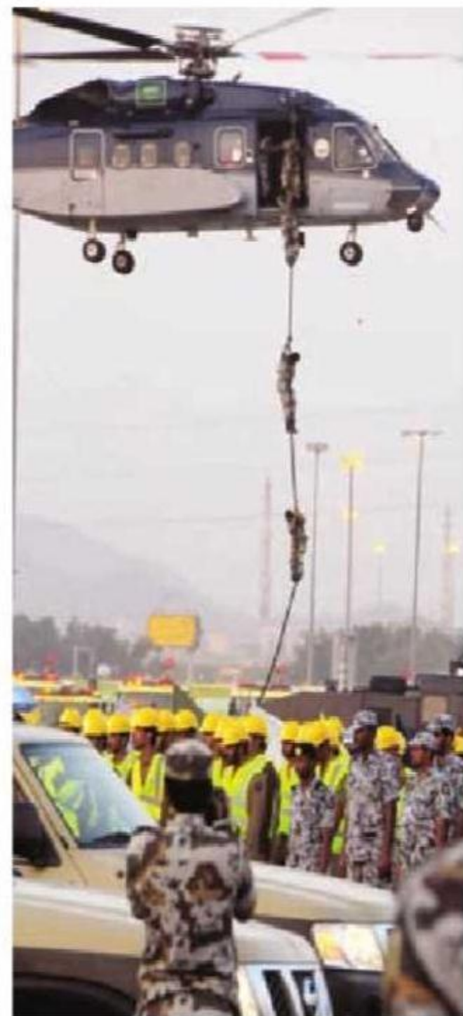
عملية الإنزال من المروحية