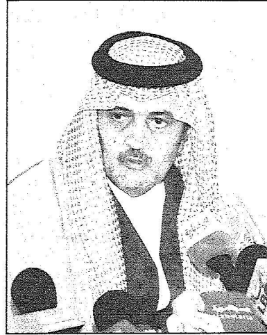
الأمير سعود متحدثاً للصحافيين

وحول حجم المشاركة على مستوى القيادة في أعمال المؤتمر أفاد سموه أن الحضور كبير مؤكداً أن ذلك سيظهر غداً - اليوم - وأوضح سموه وزير الخارجية خلال