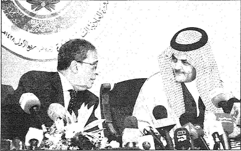
سمو وزير الخارجية وأمين الجامعة العربية خلال المؤتمر الصحافي