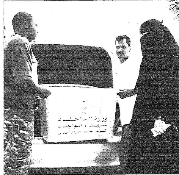
توزيع سلال غذائية على المحتاجين في رمضان بأسم شهداء الواجب