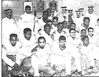
سموه يستقبل منتخب المملكة لكرة القدم لذوي الاحتياجات الخاصة