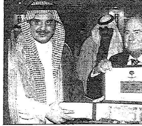
ويقدم هدية للسيد جوزيف بلاتر

كما أشار سموه إلى أن الرئاسة واللجنة الأولمبية والاتحادات الرياضية ترتبط بعدد من الاتفاقيات ومذكرات التفاهم مع عدد من الدول العربية والإسلامية والصديقة تتعلق بتنظيم برامج مشتركة تشتمل على تبادل الزيارات بين الوفود الشبابية والرياضية وإقامة المعسكرات التدريبية المشتركة والاستفادة من الخبرات في مجال التدريب والتحكيم والإدارة والإعلام والتعليق والطب الرياضي التي يقوم معهد إعداد