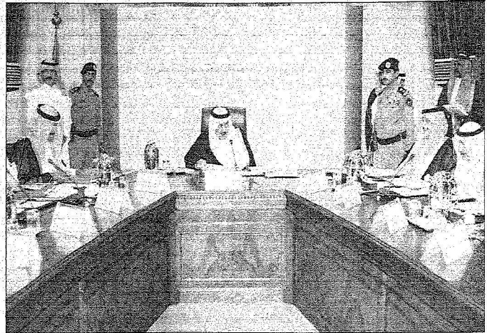
الأمير نايف خلال ترؤسه الاجتماع

الأمير سلطان بن سلمان: تتطلع لاجل الملكة الخيار الأول لمواطنيها سياحياً