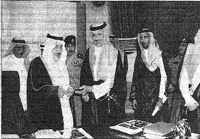
الأمير نايف يتسلم جائزة أفضل تطبيق الكتروني