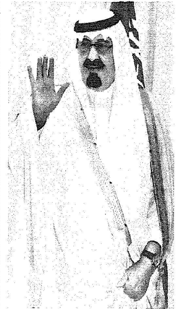
الملك عبد الله