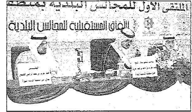
سمره في الحفل