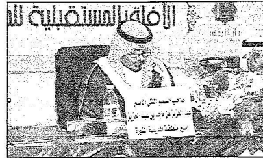
الأمير يلقي كلمته