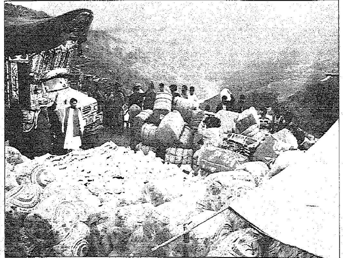
مساعدات سعودية للتصوري واثالي باكستان