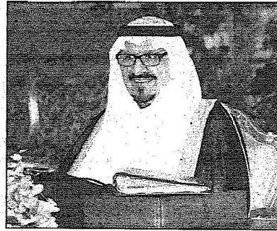
نائب خادم الحرمين مقرئاً جلسة مجلس الوزراء