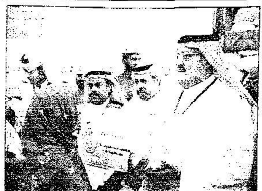
فريق المتطوعين السعوديين في بلوشستان (ذو القعدة ١٤٣١ هـ)