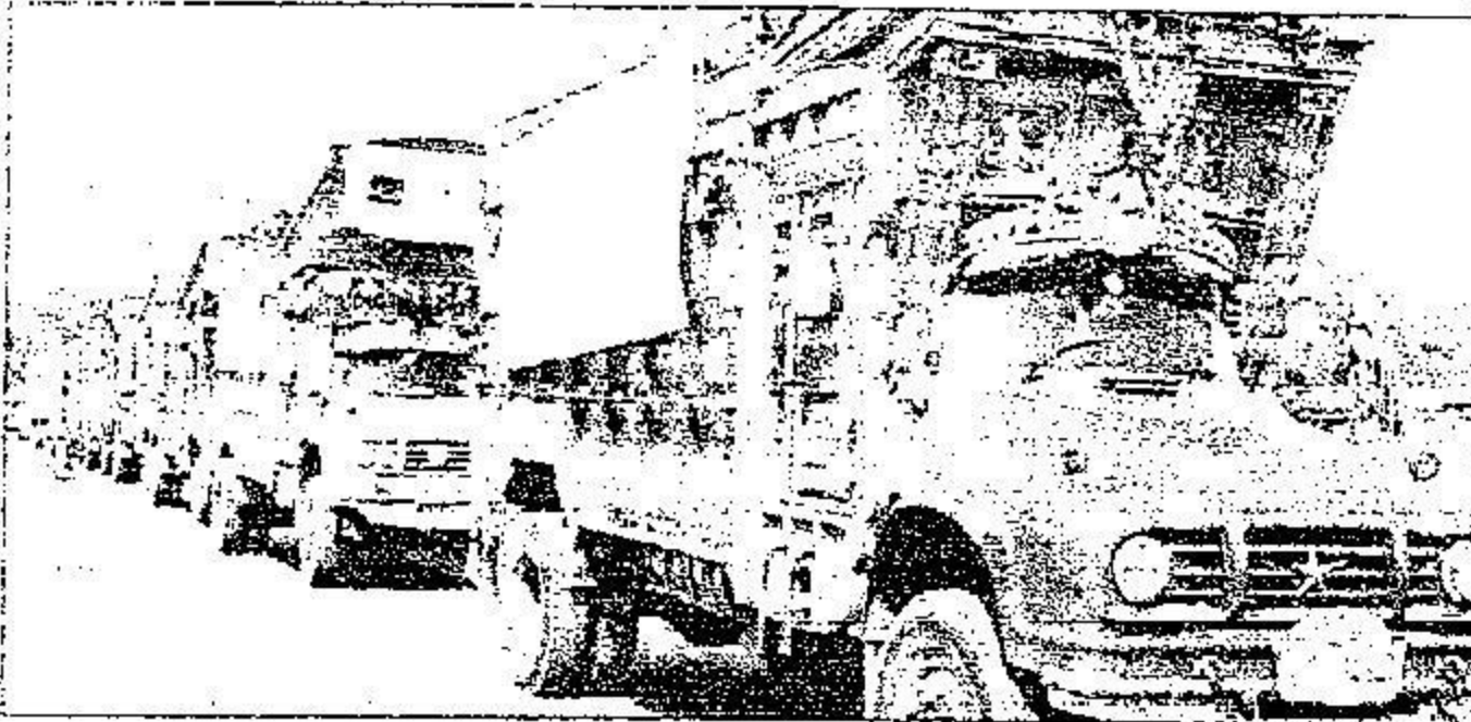
حملة خادم الحرمين الشريفين الثانية إلى بيشاور أرمضان ١٤٣١ هـ

عن جهود المملكة في خدمة الإسلام وقضاياها، فإنها تقوم بإطلاع العالم كله على هذه الجهود التي كانت ولا تزال مضيئة مثل كل مدخل، وتعتبر عن الأسس المتينة التي قامت عليها