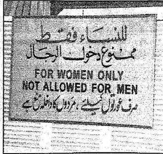
مخزن النساء قطب يوعي للحرم