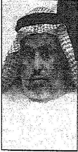
رئيس المفوضية مدير الابواب