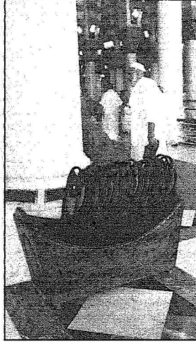
كراسي لكبار السن