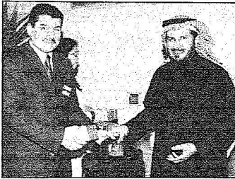
د. الربيعية يسلم أحد الأطباء هدية تذكارية