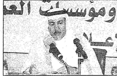
فيصل بن معمر خلال مؤتمره الصحفي