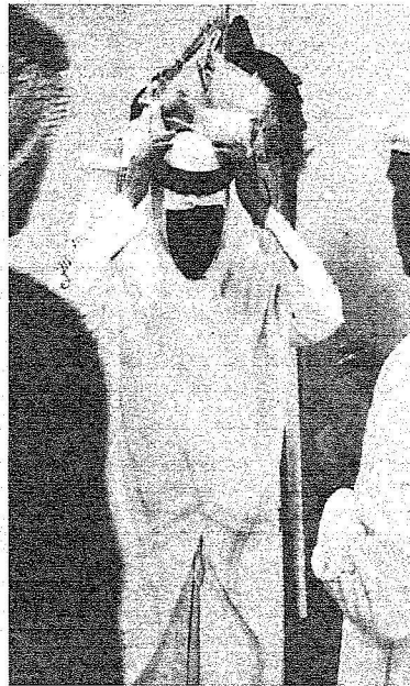
..ويعدل عقاله قبل دخوله إلى مسرح الحفل