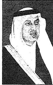
الأمير خالد الفيصل

مقدمتهم معالي محافظ الطائف فهد بن عبدالعزيز بن معمر مواصلة الجهود لإعادة إحياء تاريخ سوق عكاظ، وشكلت العديد من اللجان لبحث الفكرة والعمل على تنفيذها بعد التوصل إلى قناعة كاملة بأهمية موقع المرتبط تاريخه بالإسلام والجاهلية في وقت واحد وصدرت موافقة الأمير عبدالمجيد بن عبدالعزيز - رحمه الله - على الموافقة على إقامة وإنشاء مبانٍ تراثية قريبة إلى ما كانت عليه مثل هذه المباني منذ آلاف السنين، أنشئت على شكل وتصميم هندسي يواكب مراحل التطور التي شهدتها الطائف في كافة الجوانب ومنها السياحة.