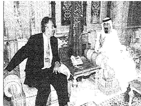
خادم الحرمين خلال اجتماعه مع بلير