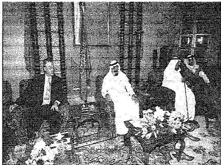
الملك عبدالله خلال الاستقبال