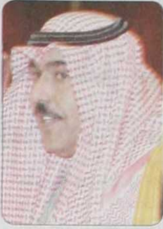
الامير مصعب بن سعود

على خريطة بلادنا يحظى بالرعاية والاهتمام من لدن القيادة الرشيدة، وقال : إن ما حملته ميزانية الخير والعطاء لهذا العام من مشاريع تنموية أكبر شاهد على اهتمام القيادة الرشيدة حيال توفير جل الخدمات والمرافق للمواطنين في ظل بحبوحة العيش الرغيد الذي ينعم بها المواطن السعودي تحت مظلة الأمن ،