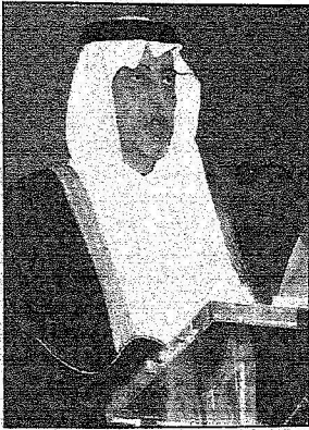
الأمير خالد الفيصل يلقي كلمته