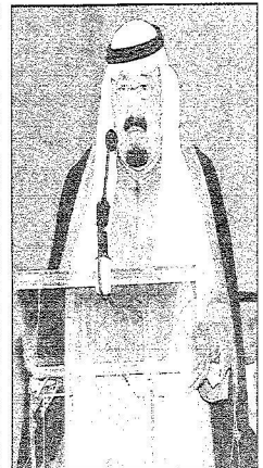
الملك بنلي كلف