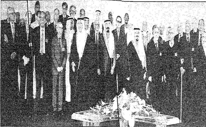
خدم الحرمين والأمين سلطان وأمين خائف الفيصل في صورة تذكارية مع القلائد

الملك عبدالله: قبلت الجائزة نيابة عن كل مسلم ومسلمة خدموا الإسلام بصمت