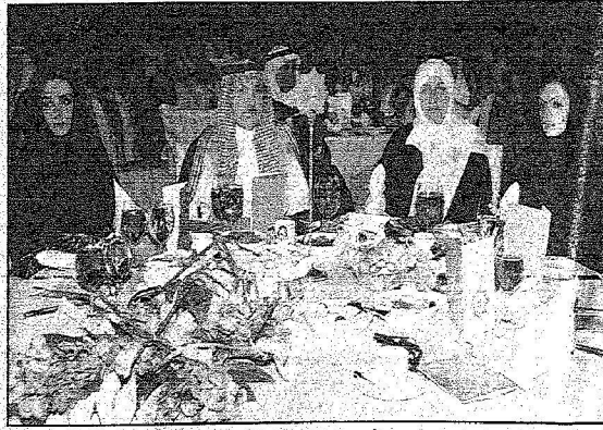
الأمير سلطان بن خالد حضوره العشاء