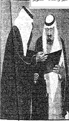
للملك عبدالله بن عبدالعزيز جائزة الملك فيصل للخدمة الإسلامية