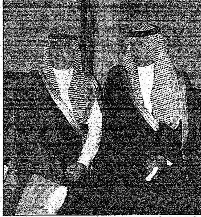
الأمير متعب بن عبدالله والأمير سلطان بن سلمان

الشريفيين مقر الحفل مودعا بمقلما استقبال به من حفاوة وتكريم. حضر الحفل ومأدية العشاء صاحب السمو الملكي الأمير متعب بن عبدالعزيز وزير الشؤون البلدية والقروية وصاحب السمو الملكي الأمير نايف بن عبدالعزيز وزير الداخلية وأصحاب السمو الملكي الأمراء ومعالي رئيس مجلس الشورى وأصحاب المعالي السوزراء وضيوف الجائزة وكبار المسؤولين من مدنيين وعسكريين.