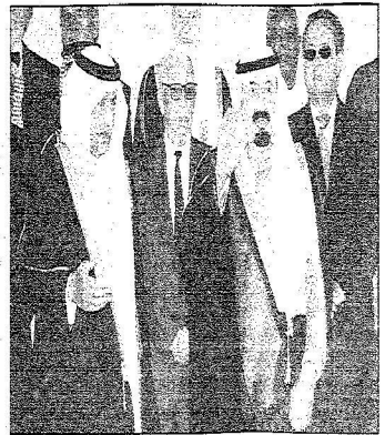
خدم الحرمين بعين الحظون لدى وسوله الملك

أكد أنه كاد يبادر بالاعتذار عن تسلمها لأن هناك من هو أحق بها