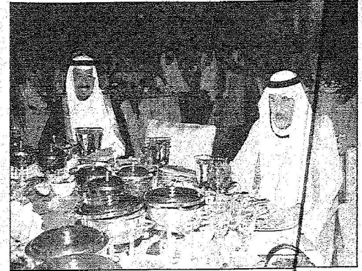
الأمير نايف والأمير سلطان بن خالد حضورهما العشاء

الأمير خالد الفيصل: خادم الحرمين القائد الشجاع والمبادر الواثق.. ه. العثيمين: إنجازات الملك عبدالله المتعددة داخلياً وخارجياً وخدمته لأمته العربية والإسلامية قادتته لترشيح