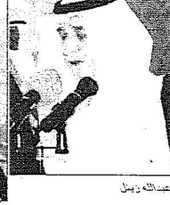
عبدالله بن تركي