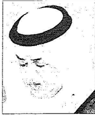
خالد بن فهد