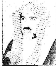
سعد بن تركي