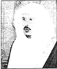
عبدالله آل الشيخ