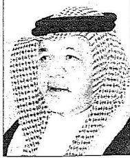
فهد بن تركي