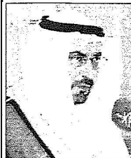
فهد بن تركي