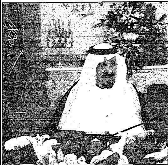
نائب خادم الحرمين مترأساً جلسة مجلس الوزراء