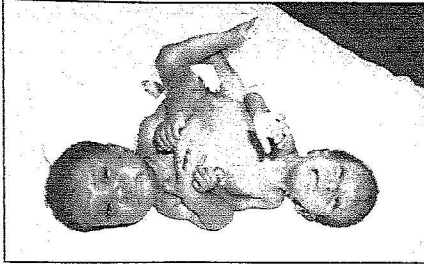
سياميتا الكاميرون قبيل عملية فصلهما غداً