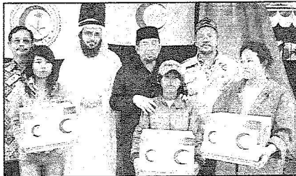
أطفال مسؤولين بالسرنام معتمهم الحملة السعودية وتولت معالجتهم وتوليف المعيشة لهم

العام على الحملة وبتابعة معالي مستشار سموه رئيس الحملة الشعبية السعودية الدكتور ساعد العرابي الحارثي في تقديم المساعدات العينية العاجلة للول المتضررة من حادث تسونامي امتداداً لتواصلها مع متضرري تسونامي وذلك انطلاقاً من اهدافها السامية وفي كلمة لمعالي مستشار سمو وزير الداخلية رئيس الحملة الخيرية السعودية لإغاثة منكوبي الزلزال والمد البحري في شرق آسيا قال فيها تحرص اللجنة قيادة وشعباً على ان تكون دائماً في موقع القلب من العمل الاغاثة العالمي ولا يرتبط عطاؤها بغرض او مصالح ذاتية ولا تتوقف مساعداتها لاعتبارات مذهبية او قومية او جغرافية او سياسية او ثقافية فهي تترك دائماً ان دورها داخل المنظومة الانسانية ليست له حدود أو موانع تؤخره أو تحجبه ولذلك فهي توظف امكاناتها وقدراتها للمشاركة الفاعلة في بناء عالم تسوده المحبة وقائم على التكافل والتعاقد والانسجام بعيداً عن إملاءات المصالح والصراعات السياسية والثقافية ويشهد على