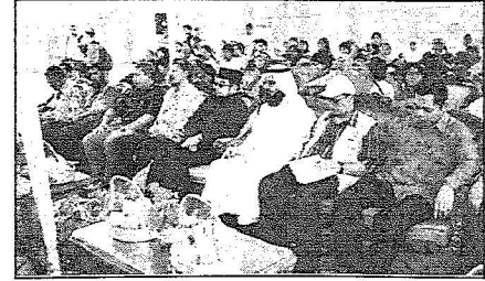
الزميل السبهي والخلف والسفير الاندونيسي بالملكة وعدد من المسؤولين في الحفل الختامي للمستشفى