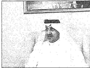
سمو أمير منطقة مكة

قال صاحب السمو الملكي الأمير خالد الفيصل أمير منطقة مكة المكرمة ورئيس لجنة الحج المركزية إن تجربة الأبراج السكنية في مشعر منى قيد التجربة الآن وستتم دراستها من جميع النواحي ليتخذ الملك المفدى فيما بعد القرار المناسب حولها.